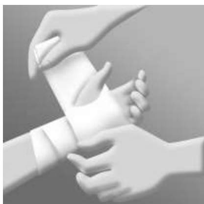
Bind in handleden med ett elastiskt förband först i riktning mot handflatan. Linda förbandet runt tummen och sedan över handflatan och klipp ett hål i förbandet för tummen på följande varv.