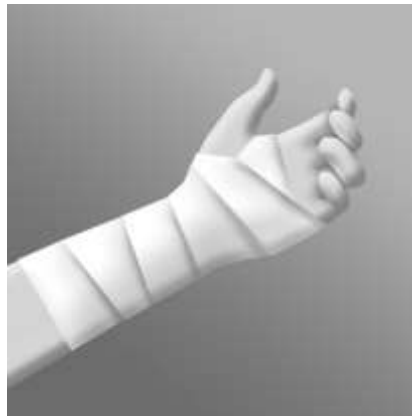
Vira förbandet längs armen, upp över handleden och fäst det. Byt förbandet två gånger om dagen, om inte läkaren föreskriver annat.